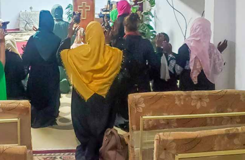
Nabożeństwo w jemeńskim kościele domowym