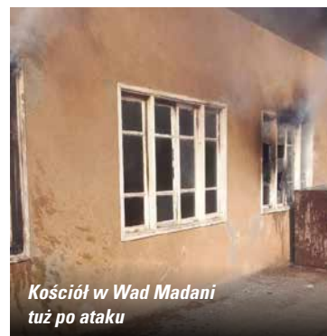
Kościół w Wad Madani tuż po ataku

SUDAN: 12 stycznia, po raz drugi w ciągu około dwóch tygodni, islamscy ekstremiści podpalili kościół protestancki w Wad Madani. Podziękujemy Jezusowi, że ogień nie zdołał zniszczyć całego budynku, a chrześcijanie nie dali się zastraszyć, ale nadal odważnie podążają za Jezusem. /