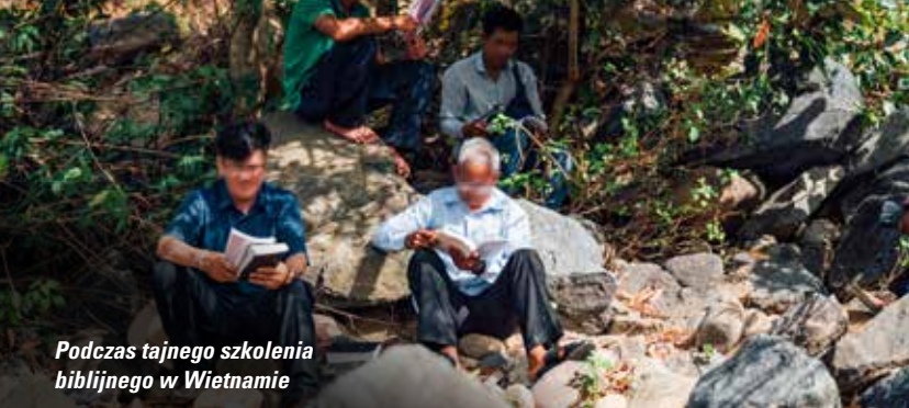
Podczas tajnego szkolenia biblijnego w Wietnamie