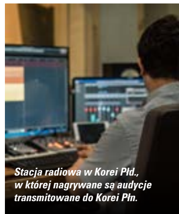
Stacja radiowa w Korei Płd., w której nagrywane są audycje transmitowane do Korei Płn.

Mieszkańcy Korei Północnej mogą odbierać audycje radiowe nadawane z sąsiednich krajów. Reżim dąży do całkowitej izolacji swoich obywateli i surowo każe osoby, które słuchają zagranicznych rozgłośni. Módlmy się o bezpieczeństwo chrześcijan, którzy w poszukiwaniu duchowego pokarmu słuchają chrześcijańskich programów nadawanych z Korei Południowej. /