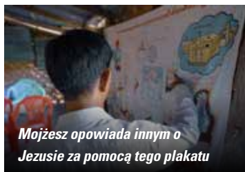
Mojżesz opowiada innym o Jezusie za pomocą tego plakatu

głoszą Ewangelią, doświadczają silnej wrogości (zob. str. 10-11). Prośmy Jezusa Chrystusa, aby chronił ich przed atakami. /