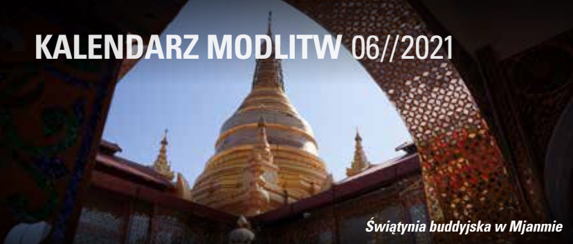
Świątynia buddyjska w Mjanmie