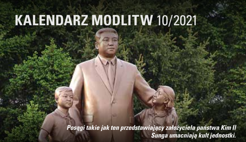
Posągi takie jak ten przedstawiający założyciela państwa Kim II Sunga umacniają kult jednostki.