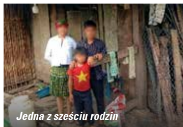
Jedna z sześciu rodzin